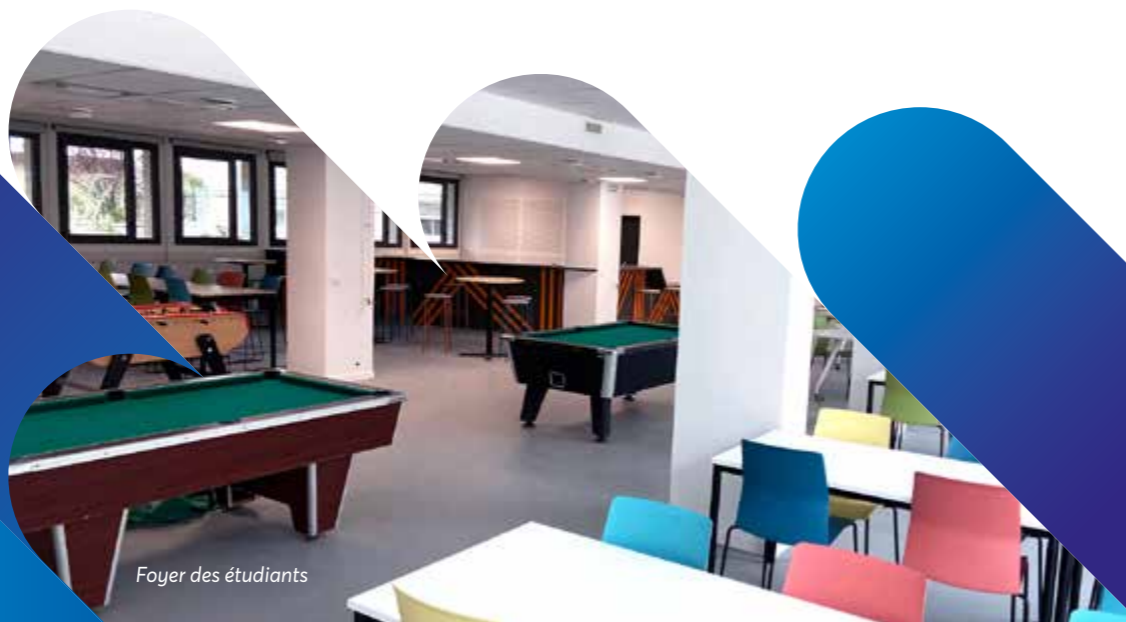
Foyer des étudiants